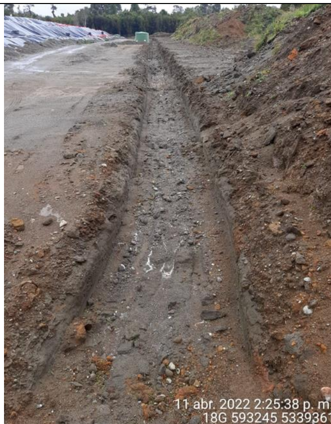
Fotografía N°20: Estado canales aguas lluvias