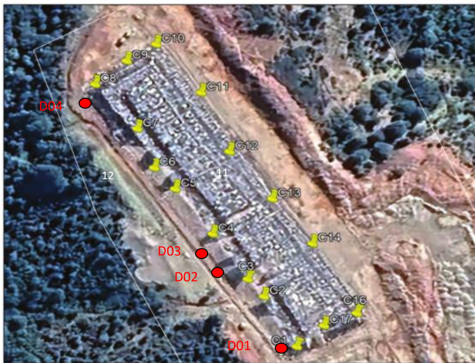
Fotografía N°15: Zanja Sanitaria N°1. Imagen Aérea I. Municipalidad de Ancud.

Se adjunta imagen donde se encuentra personal de Municipal realizando mediciones de cámaras de monitoreo de sobrecelda. Se realiza misma técnica de medición de cámaras realizada en terreno por la SMA al momento de inspeccionar el recinto sanitario.