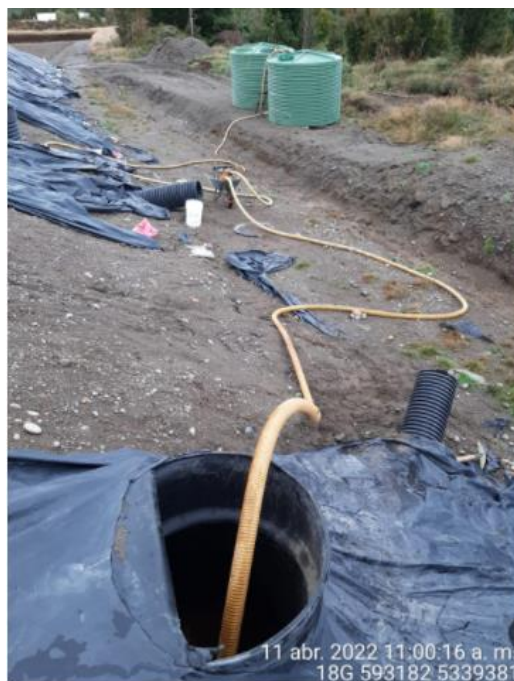
Fotografía N°1: Extracción de Lixiviados desde cámaras C03 por personal municipal. Tomada: Lunes 11 de Abril del 2022.

Para dar cumplimiento a lo indicado en Res. Exenta N°451. A continuación, se presenta el registro fotográfico de las actividades de extracción de la semana del 11 al 17 de abril del 2022.