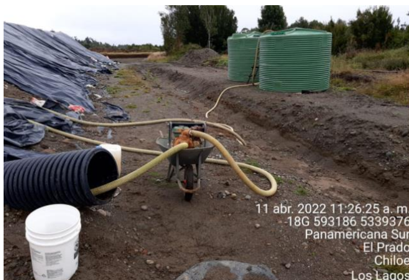
Fotografía N°2: Extracción de Lixiviados desde diagonal D02. Tomada: Lunes 11 de Abril del 2022.