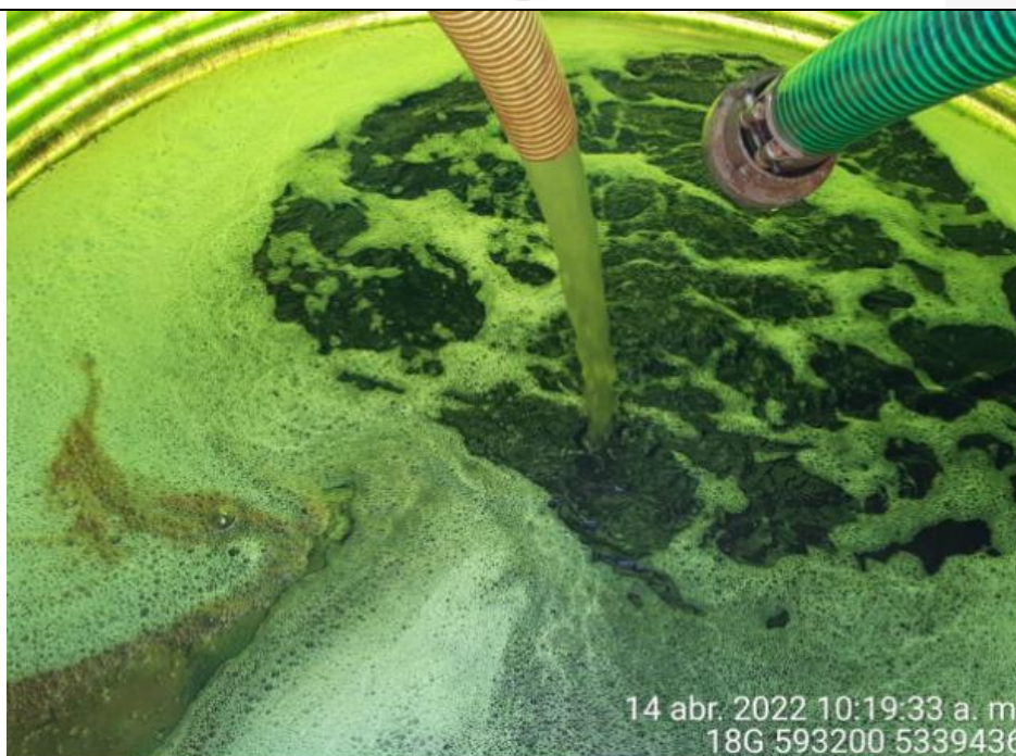
Fotografía N°14: Extracción de Lixiviados a estanque por personal municipal. Tomada: Jueves 14 de Abril del 2022.

Respecto a los retiros de lixiviados se mencionan en la siguiente tabla el cronograma y Cantidad de lixiviados retirados por jornada correspondiente del 11 al 17 de Abril del 2022.