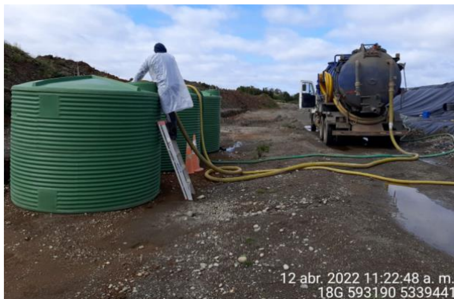
Fotografía N°6: Retiro de Lixiviados por Empresa Tresol. Tomada: Martes 12 de Abril del 2022.