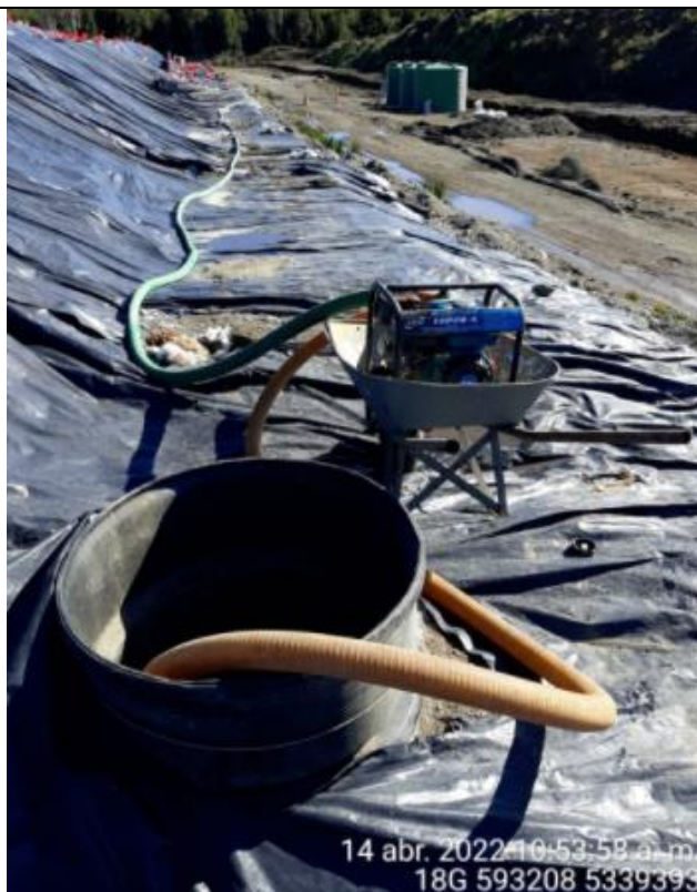
Fotografía N°13: Extracción de Lixiviados Cámara C14 por personal municipal. Tomada: Jueves 14 de Abril del 2022.