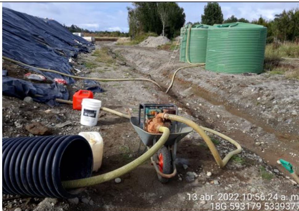
Fotografía N°9: Extracción de Lixiviados Diagonal D02. Tomada: Miércoles 13 de Abril del 2022.