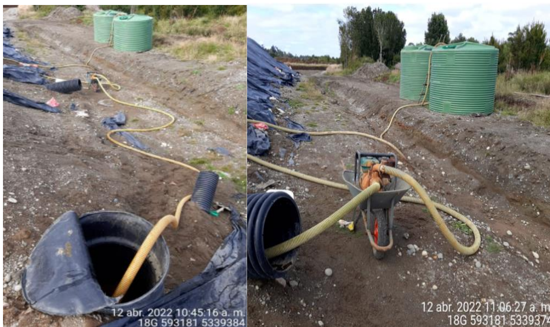
Fotografía N°4: Extracción de Lixiviados C03 y D02 por personal municipal. Tomada: Martes 12 de Abril del 2022.