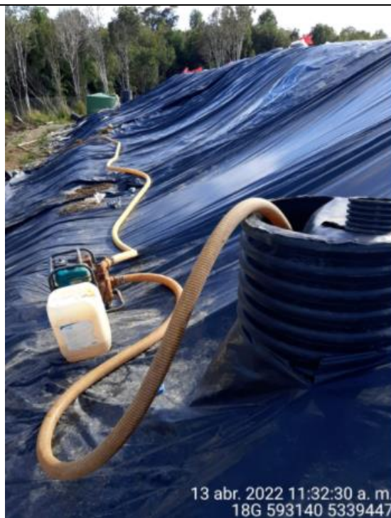
Fotografía N°7: Extracción de Lixiviados cámara C07 por personal municipal. Tomada: Miércoles 13 de Abril del 2022.