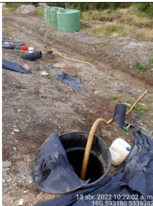
Fotografía N°8: Extracción de Lixiviados cámara C03 por personal municipal. Tomada: Miércoles 13 de Abril del 2022.