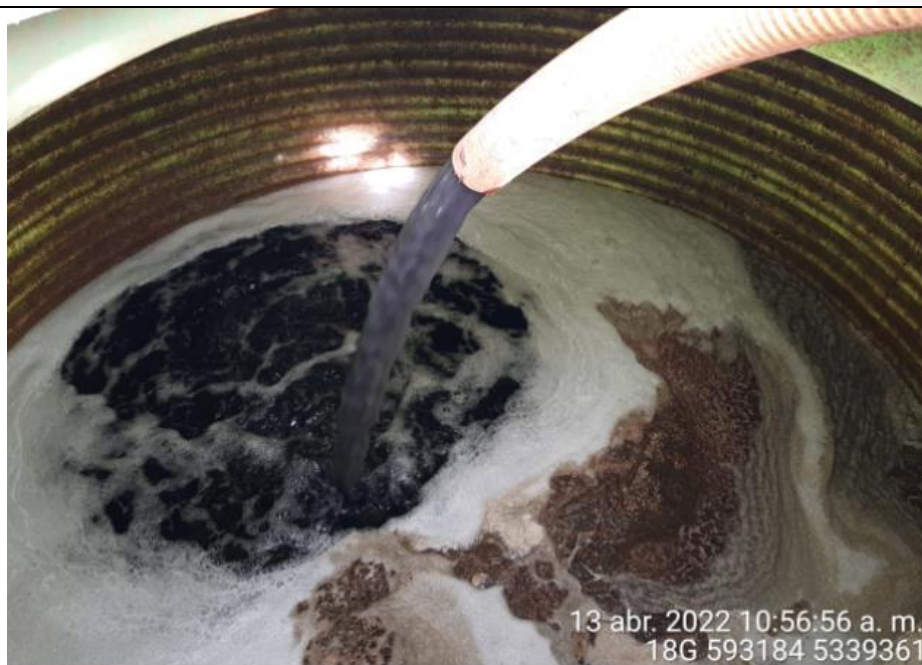
Fotografía N°10: Extracción de Lixiviados a estanque. Tomada: Miércoles 13 de Abril del 2022.