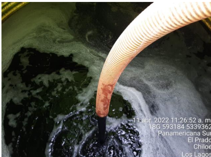
Fotografía N°3: Extracción de Lixiviados a estanque por personal municipal. Tomada: Lunes 11 de Abril del 2022.