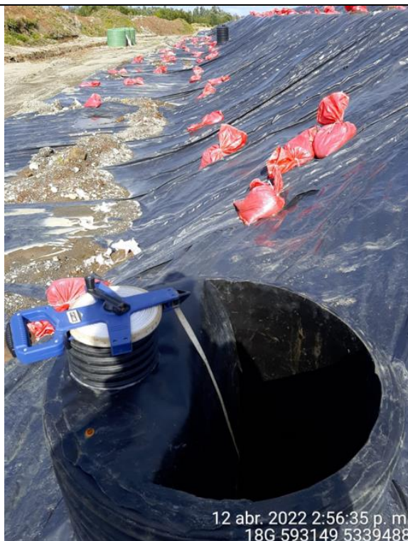
Fotografía N°17: Medición de Niveles de cámaras por Personal Municipal. Tomada: 12 de Abril del 2022.