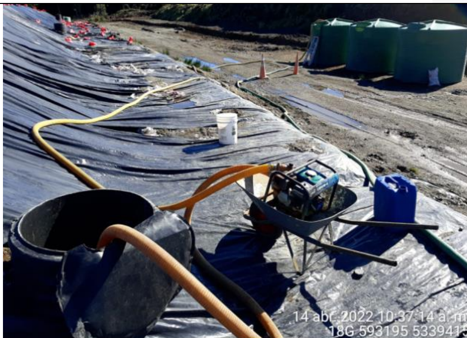
Fotografía N°12: Extracción de Lixiviados Cámara C13 por personal municipal. Tomada: Jueves 14 de Abril del 2022.