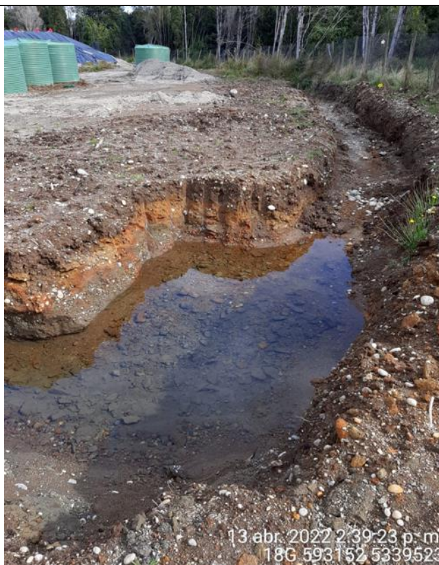
Fotografía N°22: Estado canales aguas lluvias