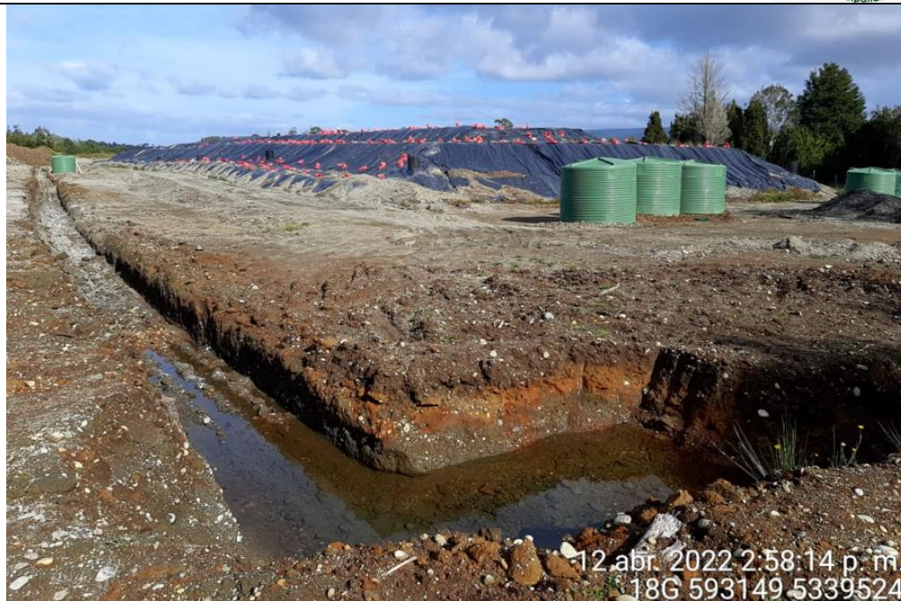
Fotografía N°21: Estado canales aguas lluvias