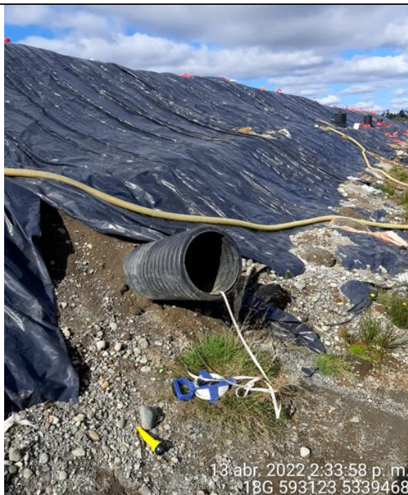
Fotografía N°18: Medición de Niveles de cámaras por Personal Municipal. Tomada: 13 de Abril del 2022.