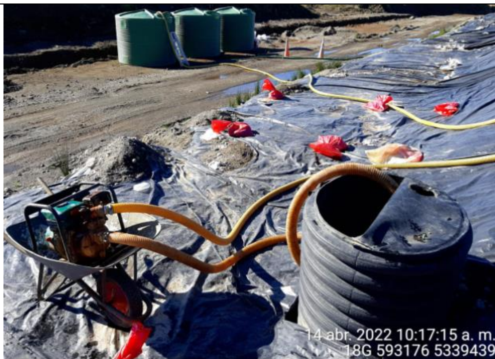
Fotografía N°11: Extracción de Lixiviados Cámara C12 por personal municipal. Tomada: Jueves 14 de Abril del 2022.