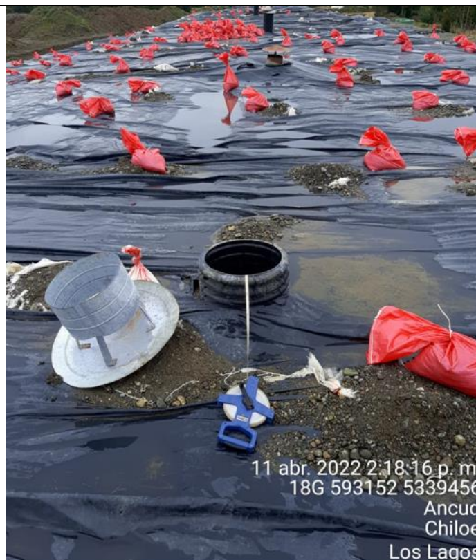
Fotografía N°16: Medición de Niveles de cámaras por Personal Municipal. Tomada: 11 de Abril del 2022.