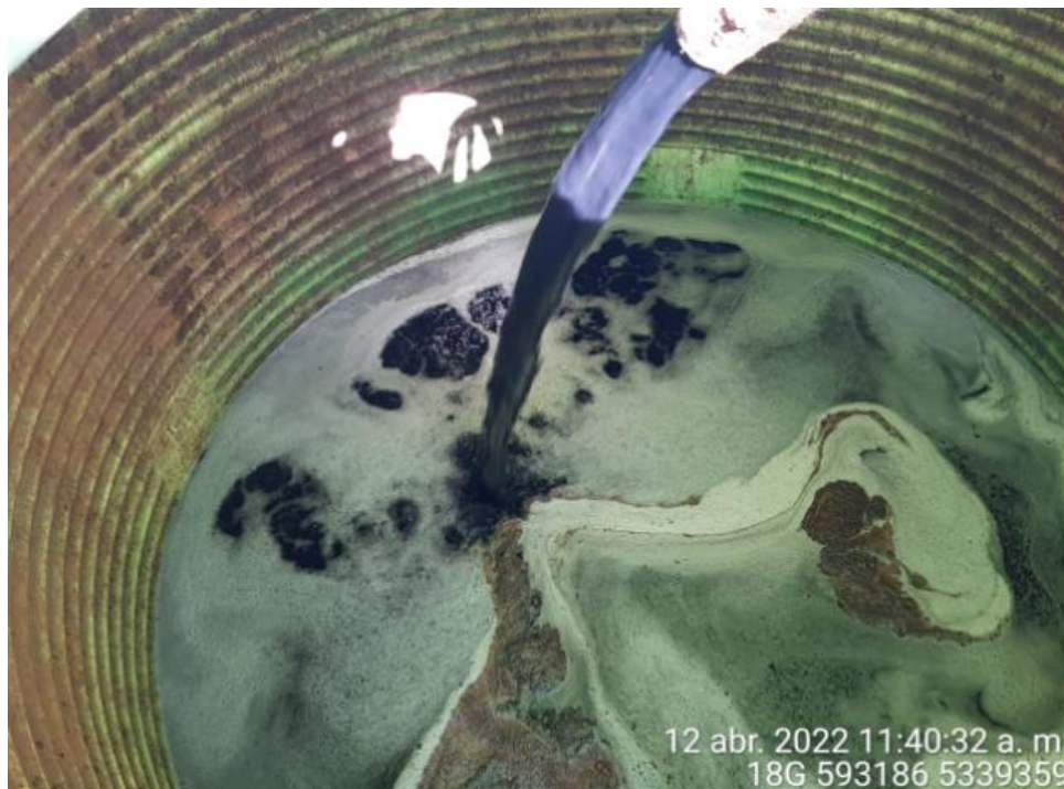
Fotografía N°5: Extracción de Lixiviados por personal municipal. Tomada: Martes 12 de Abril del 2022.